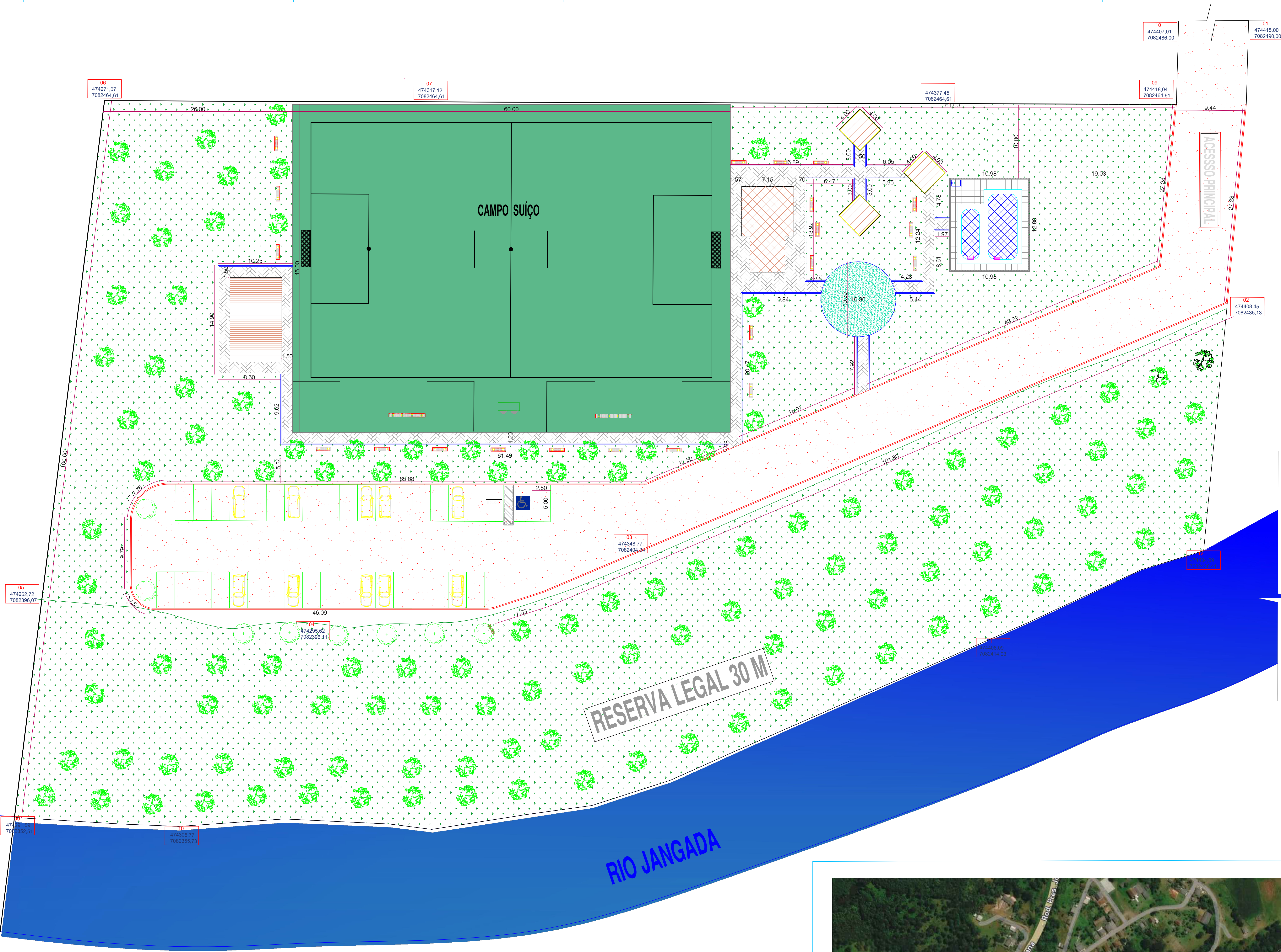
1 SITUAÇÃO E LOCALIZAÇÃO ESCALA 1:200